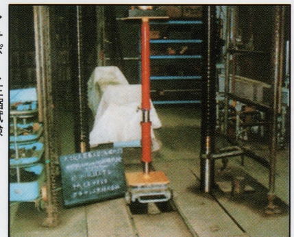
▶ サポート圧縮試験